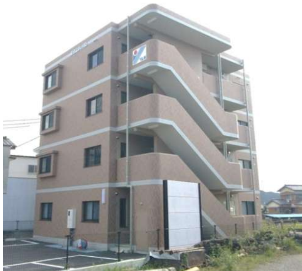
完成予想図 実際とは多少異なります。