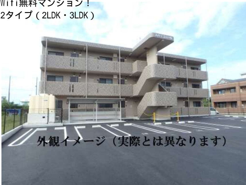
外観イメージ (実際とは異なります)